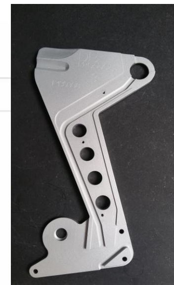
Pièce mécanique Aluminium