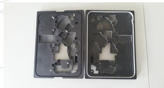
Cadre de vernissage avec capot et joint Aluminium