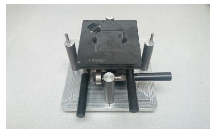
Table de sérigraphie DB Products pour billage de précision, réparation